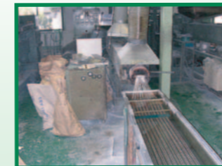
⑤破碎材料ペレット化